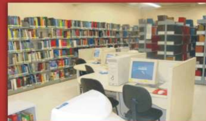
Biblioteca Carlos Fagundes de Mello, referência em cardiologia há 45 anos: biblio@cardiologia.org.br

Em Pós-Graduação Latu Sensu, oferece cursos de especialização em Enfermagem, Nutrição, Psicologia, Fisioterapia e Educação Física, além de outros em fase de instalação. Na Pós-Graduação Strictu Sensu, mantém o Programa de Pós-Graduação em Ciências da Saúde: Cardiologia e Ciências Cardiovasculares (Mestrado e Doutorado), instalado em 1988 e reformulado em 2002, avaliado pela CAPES como Conceito 4.