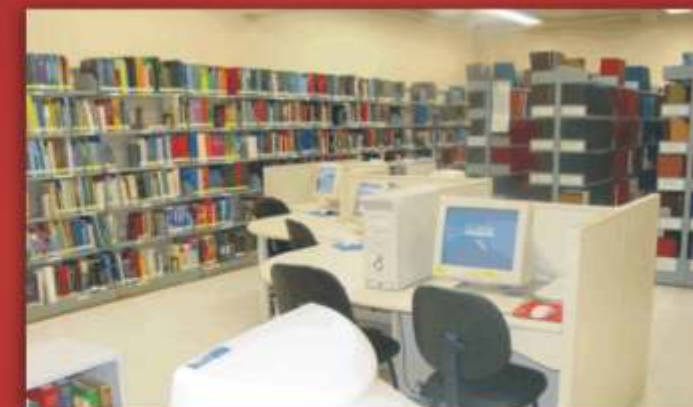
Biblioteca Carlos Fagundes de Mello, referência em cardiologia há 45 anos: biblio@cardiologia.org.br

Em Pós-Graduação Latu Sensu, oferece cursos de especialização em Enfermagem, Nutrição, Psicologia, Fisioterapia e Educação Física, além de outros em fase de instalação. Na Pós-Graduação Strictu Sensu, mantém o Programa de Pós-Graduação em Ciências da Saúde: Cardiologia e Ciências Cardiovasculares (Mestrado e Doutorado), instalado em 1988 e reformulado em 2002, avaliado pela CAPES como Conceito 4.